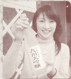
「九州大吟醸 ～交流会にてどうぞ!～」