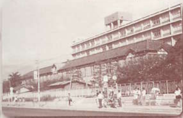
「昭和42年夏、六本松 ～九州大学の歩み写真展にて～」

※ご都合のよい時間帯からご参加ください。 ※参加費は学食メニュー(昼食)を除いて全て無料です。 ※会場には公共交通機関でお越しください。