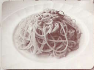
「ジロー風スパ ～なつかしの学食メニューから～」