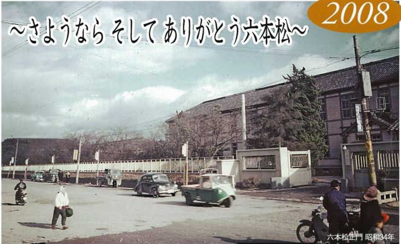
六本松正門 昭和34年

ホームカミングデーは、卒業生の皆様に、過去、現在、未来へ続く九州大学の姿をご覧いただくことを目的に一昨年からはじめました。