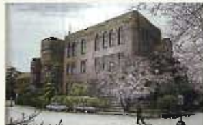
(旧工学部本館墨彩画)