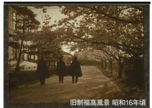
旧制福高風景 昭和16年頃